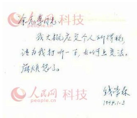
图为1994年1月3日，钱学森催办上交个人所得税事宜时的手迹。

钱学森去世已整整5周年了。作为钱老在世时的老秘书，我在整理他遗留的大量珍贵史料档案时，发现了他在80多岁高龄时给我写的几张便笺。