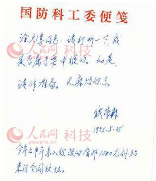
图为1995年5月25日，钱学森催办申报个人资产事宜时的手迹。