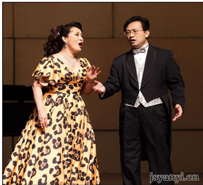
男女声二重唱《甜美的姑娘》